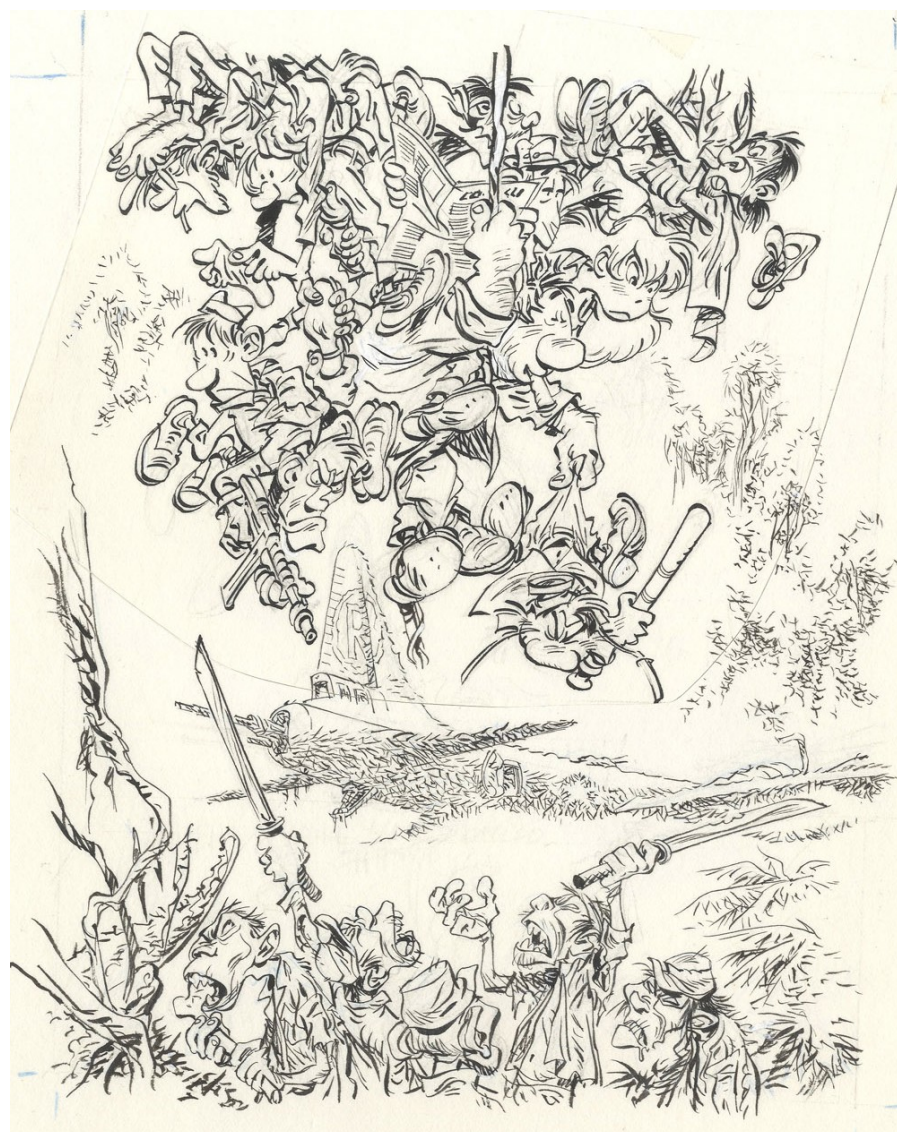
Les innomables, illustration de Conrad pour l'album Shukumei

5. Si je pouvais avec un budget de 5 000 € acquérir une ou plusieurs œuvres parmi celles proposées en vente sur 2DG ?