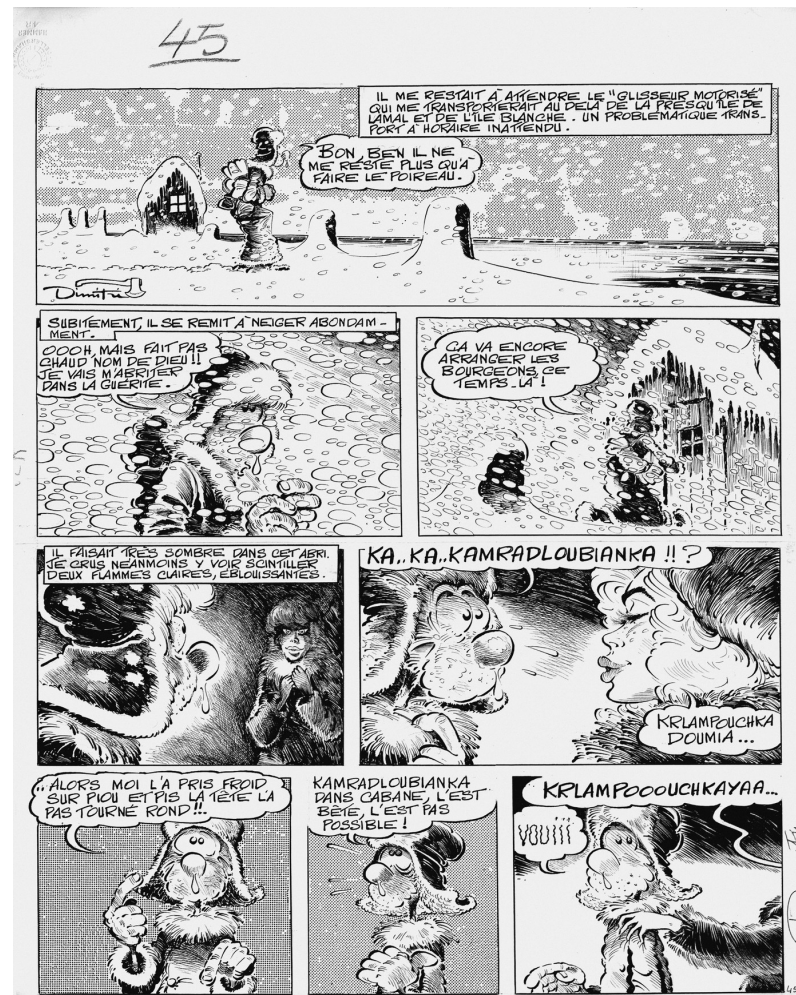
Planche originale du Goulag, par Dimitri

Elle n'a jamais quitté sa place au mur depuis son accrochage il y a 4 ans. De la même façon elle est, et a toujours été, mon choix pour le « Best Of » de 2DG !