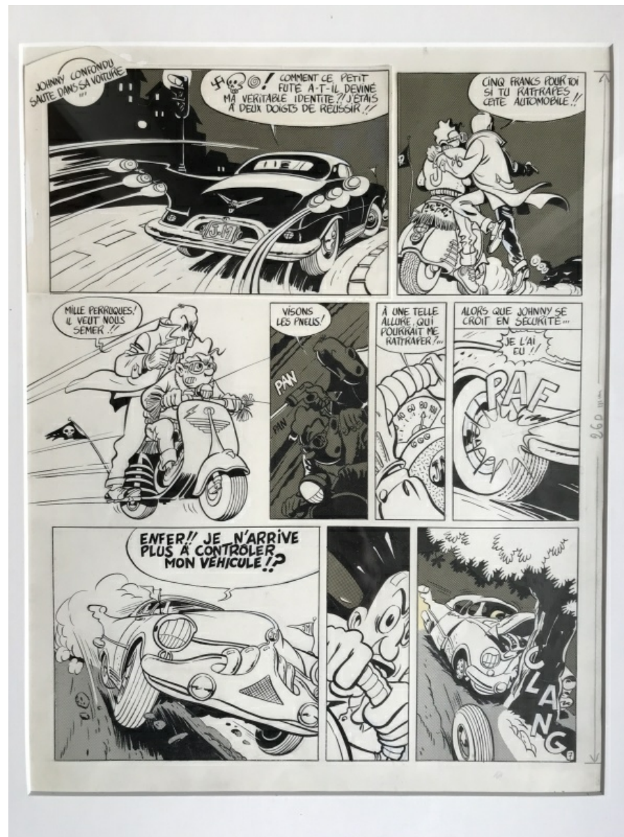
Cette planche est proposée à la vente par Andrew

ou pourquoi pas celle des Frustrés par Claire Brétécher :