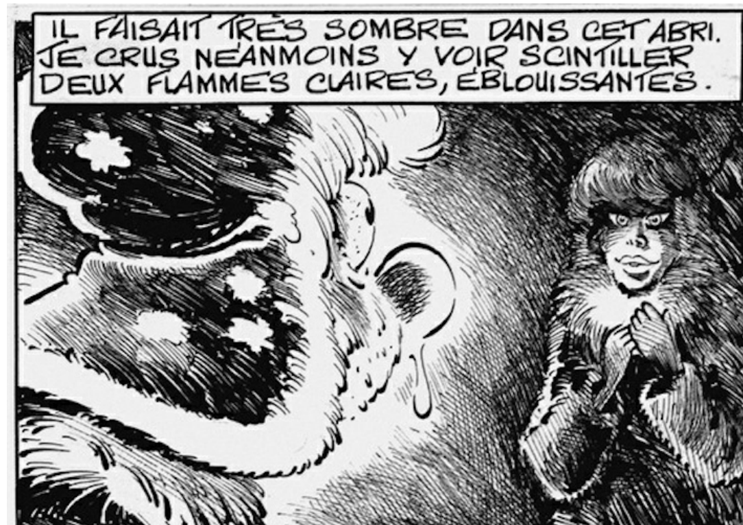
Eugène Krampon par Dimitri

7. Si j'avais la possibilité de passer une journée avec un artiste disparu ?