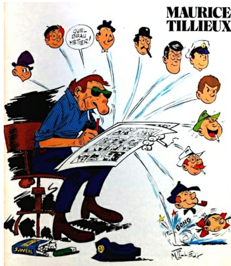
Maurice Tillieux, couverture des Cahiers de la Bande Dessinée n°34