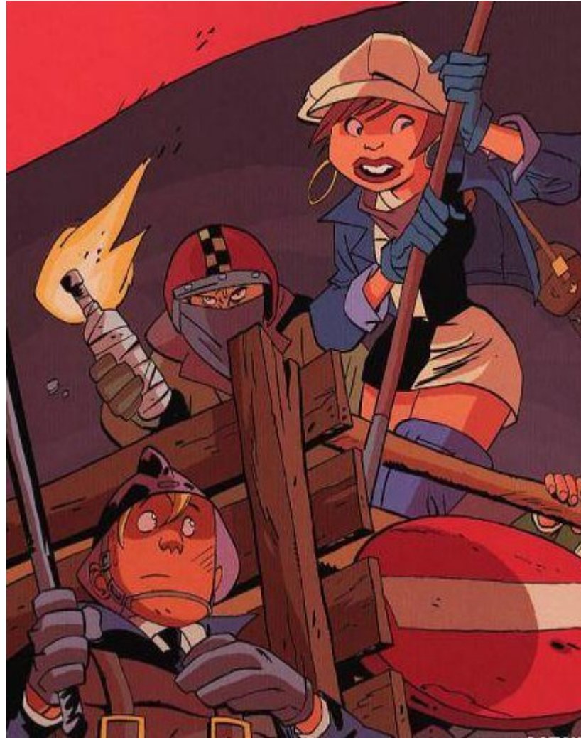
Célestin Speculoos, couverture du tome 2, Mai 68 par Bodart

Voici enfin la réponse de à une question imaginée par Bobby75 lors du précédent Si... si... si... :