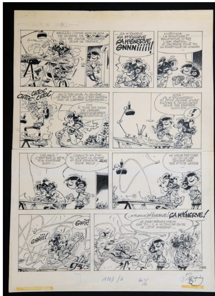
Gaston Lagaffe, Gag 792 par Franquin dans la collection de MisterA

3. Si je ne devais conserver qu'une seule œuvre dans ma collection ?