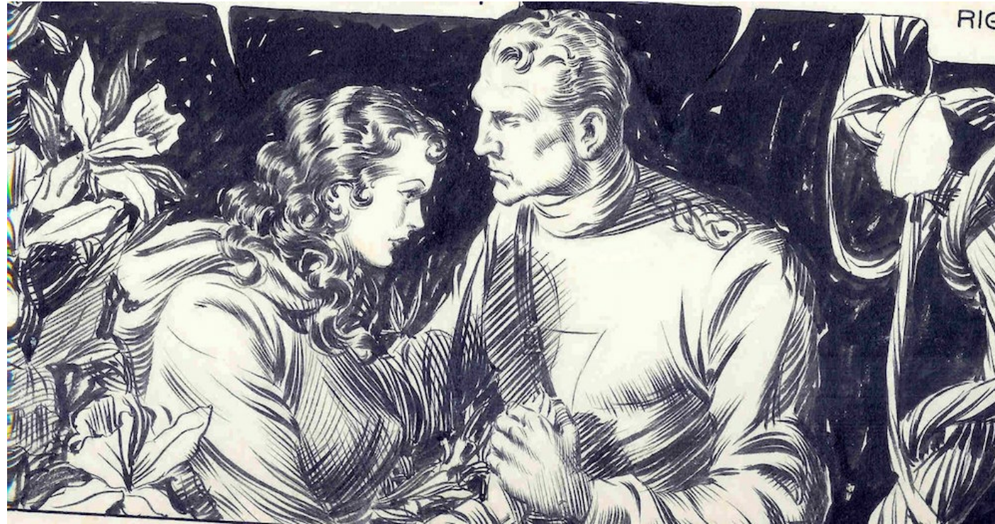
Flash Gordon par Alex Raymond

Et puis Flash est grand, beau, fort, intelligent et courageux. C'est donc un peu mon sosie en moins parfait !