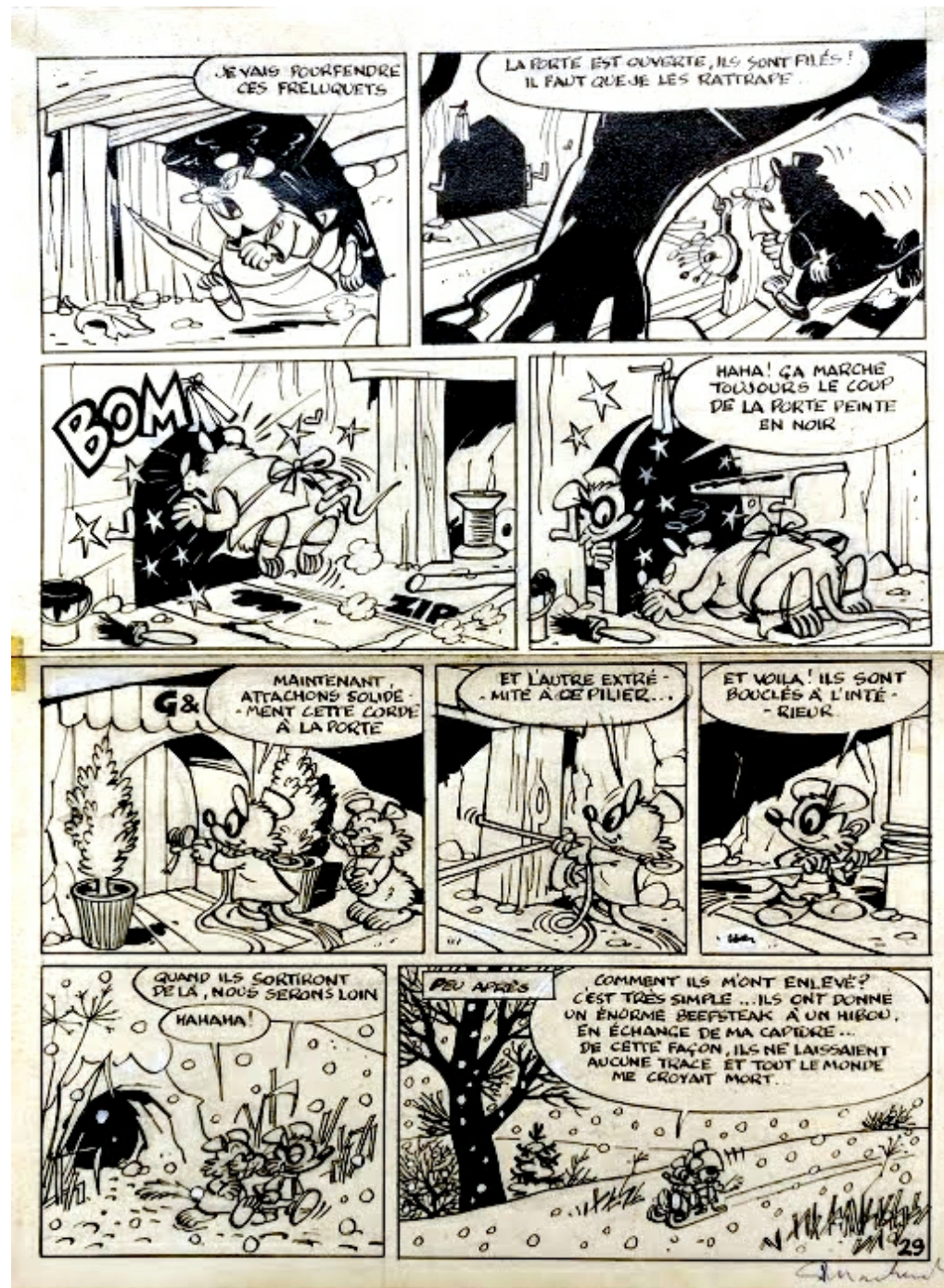
Cette oeuvre est proposée à la vente par Galerie des Bulles