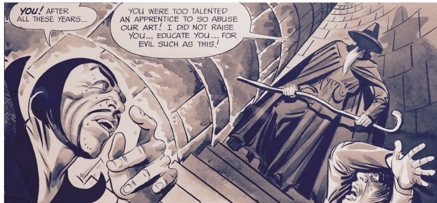
Steve Ditko - Case extraite d'une planche de la collection de Blackagar

Il fait partie pour moi dans des desinateur historiques qui resteront au panthéon de la BD et pas seulement en tant que créateur (à 80% ? ..) de Spider-Man. J'aime aussi son côté radical qui fait qu'il n'a jamais eu peur de penser ou d'agir différemment des autres. Et les grands artistes sont rarement consensuels !