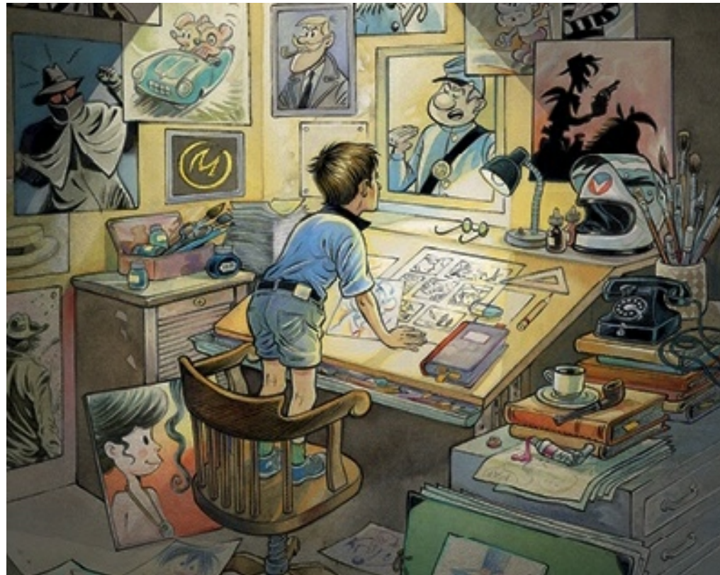
Illustration © Olivier Grenson, Les Impressions Nouvelles

J'ai découvert la BD jeune vers 7 ans avec des grands classiques de famille. Puis j'ai commencé très jeune à accumuler les éditions originales, les petits formats et les reliures de périodiques grâce au soutien financier de mes parents.