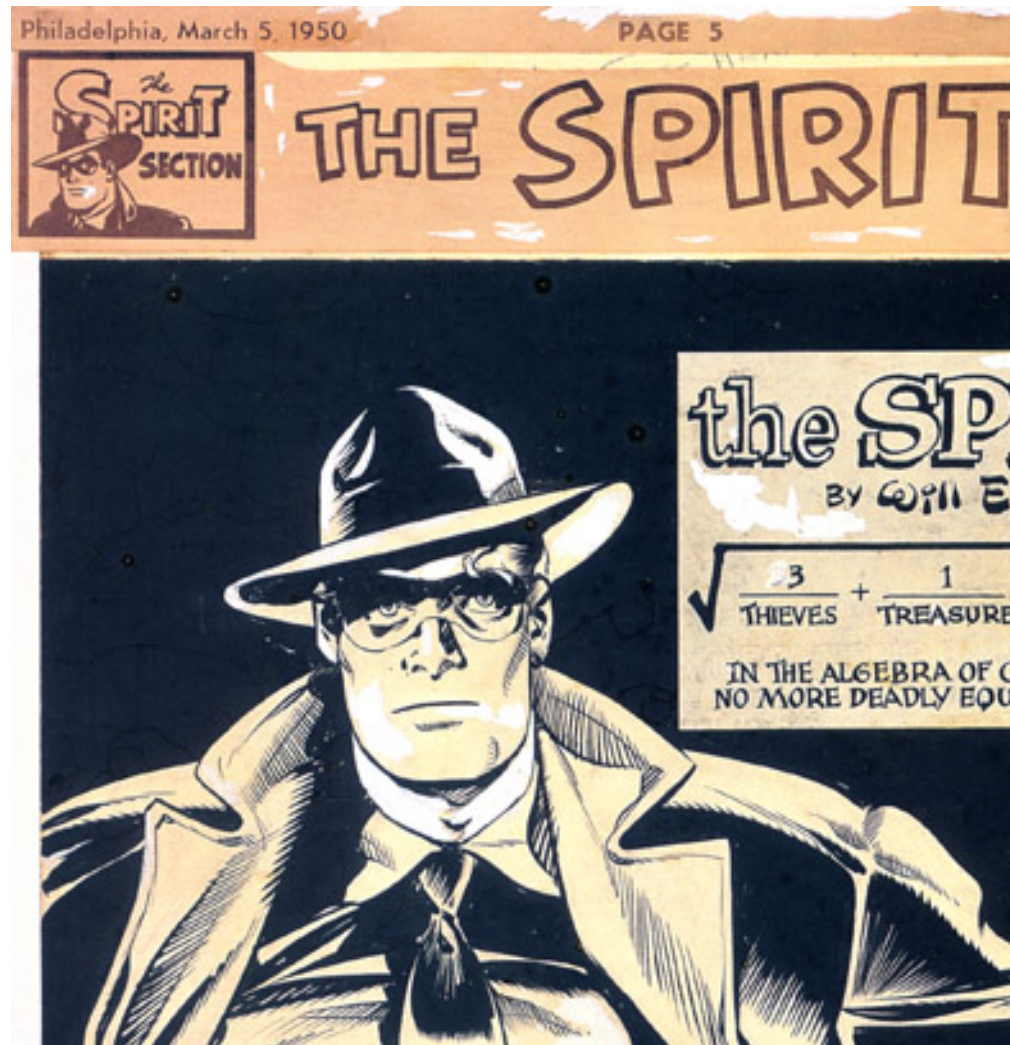
The Spirit par Will Eisner

7. Si j'avais la possibilité de passer une journée avec un artiste disparu ?