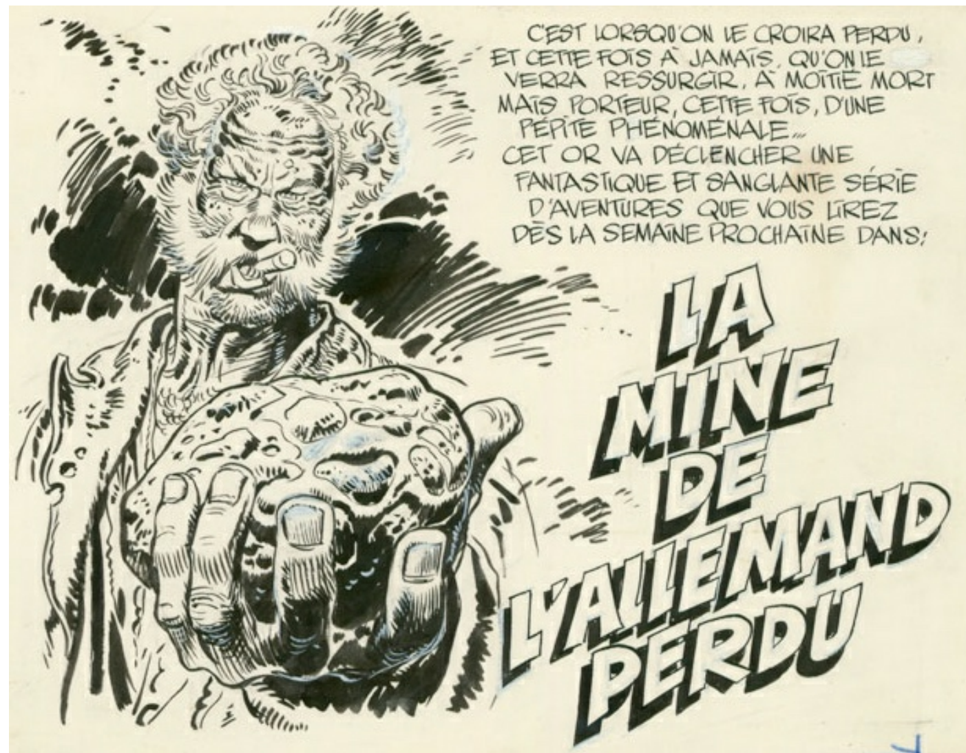
Case extraite d'une planche de la collection de BillBaroud