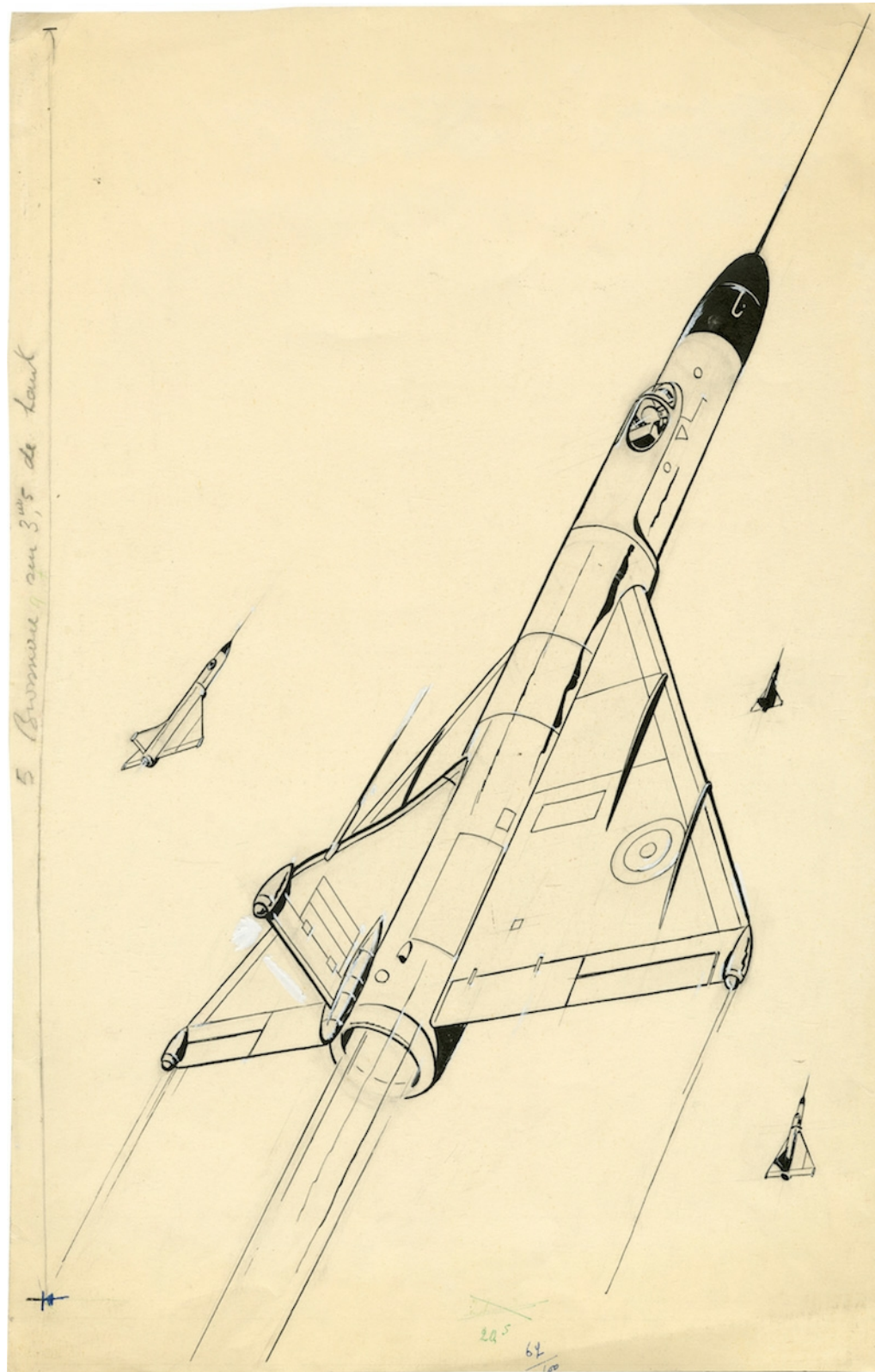
Couverture originale du Triangle bleu par Albert Weinberg