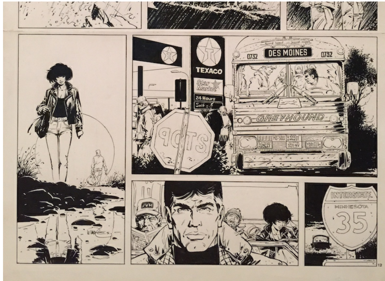
Cette planche est dans la collection de Wolverine

Vendue le 18 novembre 2006 en VAE à un collectionneur qui la possède toujours.