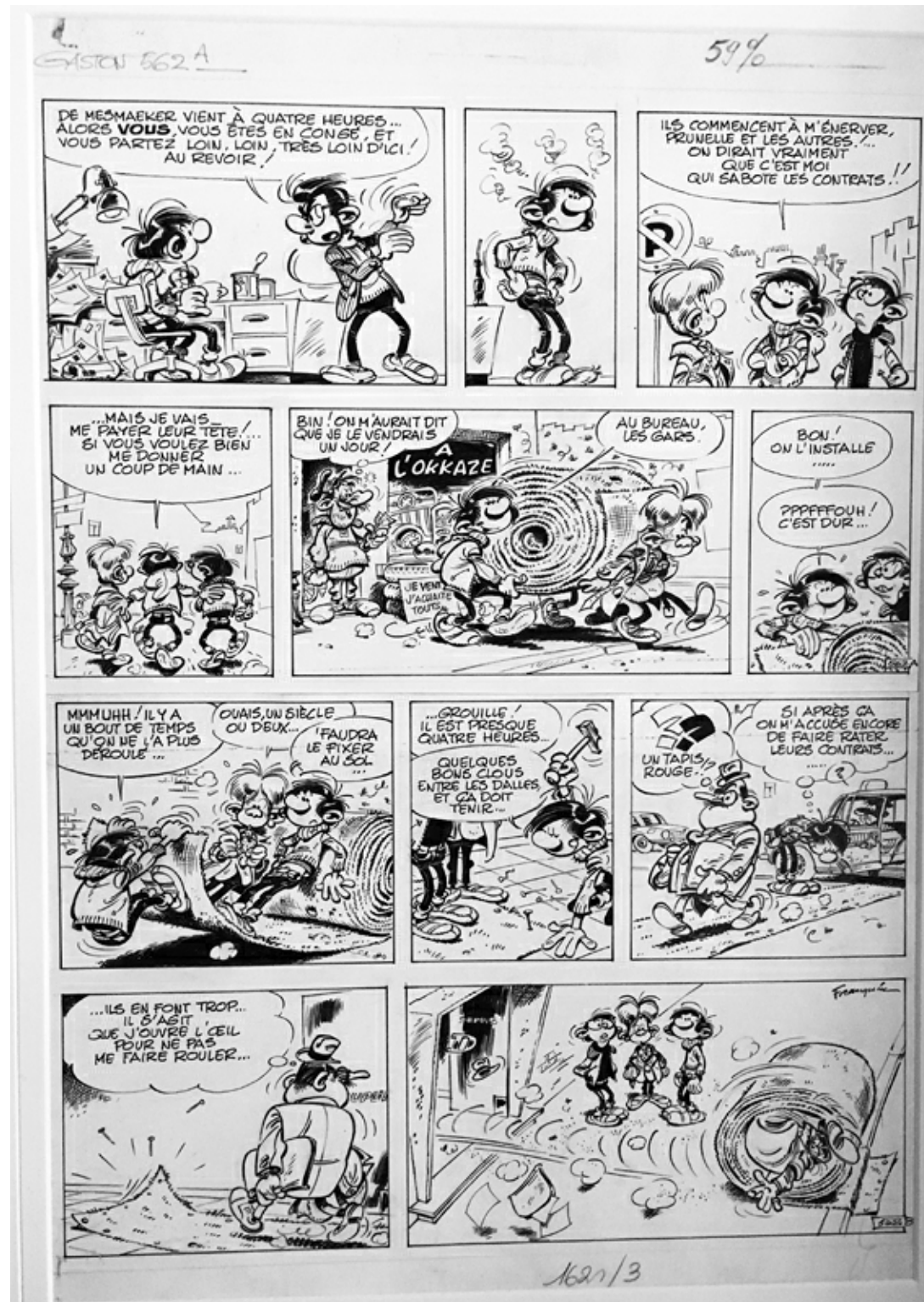
Cette planche est dans la collection de Fandesbrothers

Entre Gaston et ses amis, il y a de l'amitié et de l'entraide. Ils veulent bien faire et ne comptent pas leurs efforts, c'est plutôt touchant. Gaston est vexé par Prunelle mais il réagit en faisant preuve de générosité. C'est aussi dans ces détails que s'exprime en filigrane l'humanisme