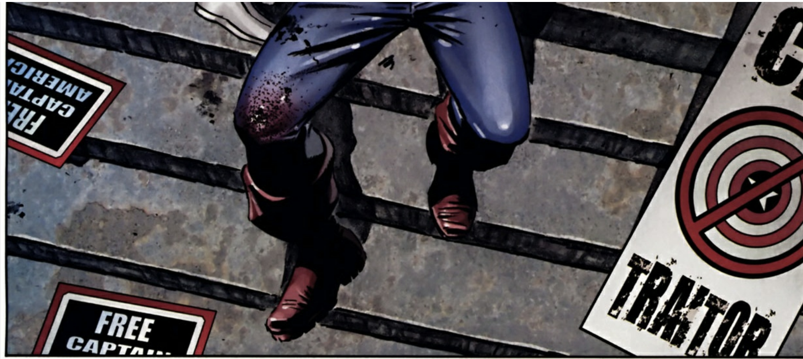
Ed Brubaker (scénario), Steve Epting (dessins), Captain America , v. 5, #25, avril 2007. La mort de Captain America, magnifiquement dessinée par Steve Epting .