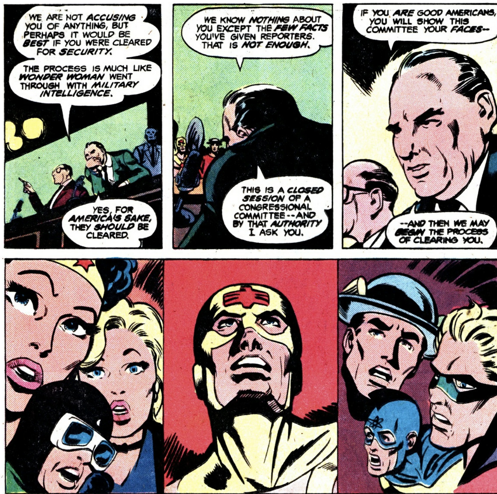
Paul Levitz (scénario), Joe Staton (dessins), Adventure Comics #466, décembre 1979. La justice Society of America de DC Comics face à un quasi-sosie du sénateur McCarthy. Les super-héros, refusant retirer leur masque, disparaîtront pour ne revenir que quelques années plus tard. À travers cette histoire Paul Levitz évoque sans doute la censure qui frappa l'industrie des comics (et particulièrement le genre des super-héros) pendant la période de la "peur des rouges" aux États-Unis.