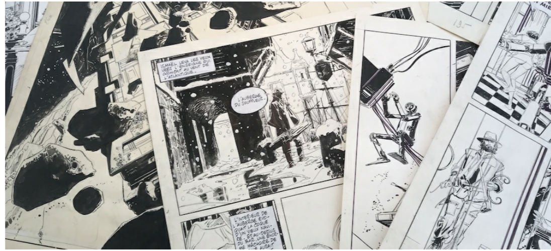
Originaux à l'encre de chine, par Paul Gillon