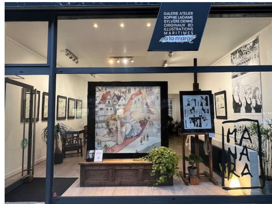
La devanture de la galerie "A la marge" à Saint-Malo