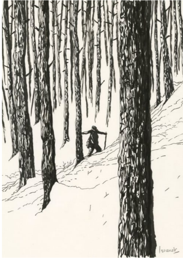
Le rapport de Brodeck par Manu Larcenet