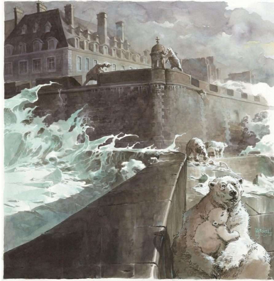
Illustration une fiction de Saint-Malo par Guillaume Sorel

5) Si vous pouviez réaliser une exposition d'un auteur (vivant ou disparu) en ayant accès à l'intégralité de sa production ?