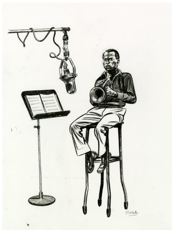
Miles Davis vu par Blutch, dans la collection de Jfmal