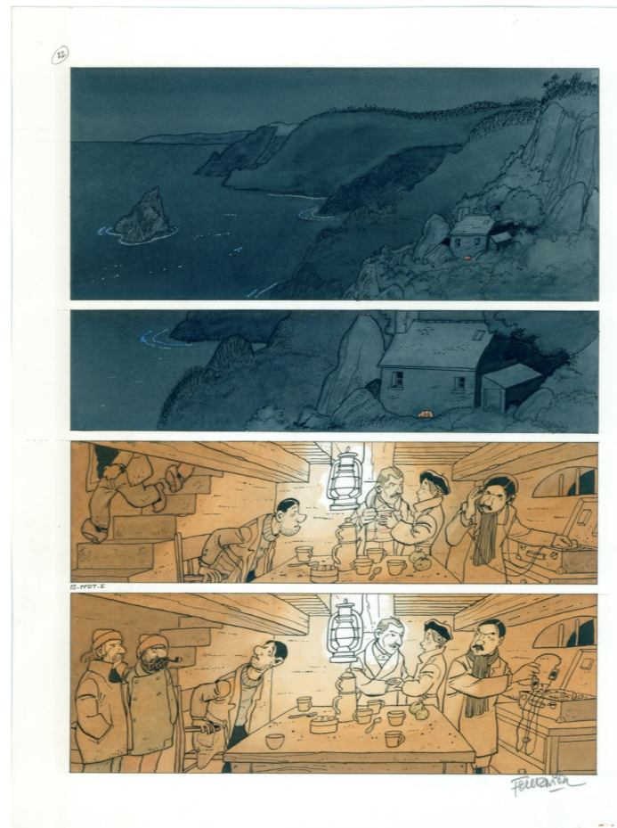
Planche originale de J-C Fournier

C'est assez exceptionnel un auteur qui se réinvente à 65 ans et qui arrive à changer complètement de style graphique pour aborder des sujets de fond. Alors oui, nous nous sommes rendus compte que les collectionneurs auraient peut-être préféré du Spirou mais pour moi, c'était une de nos plus belles expositions !