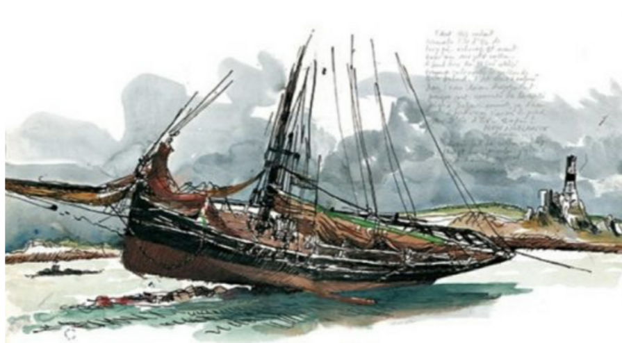
Illustration de Yvon Le Corre

Yvon Le Corre, son travail m'a énormément impressionné, il savait tout dessiner en trois traits et deux couleurs, il a marqué pour longtemps le monde du carnet de voyage.