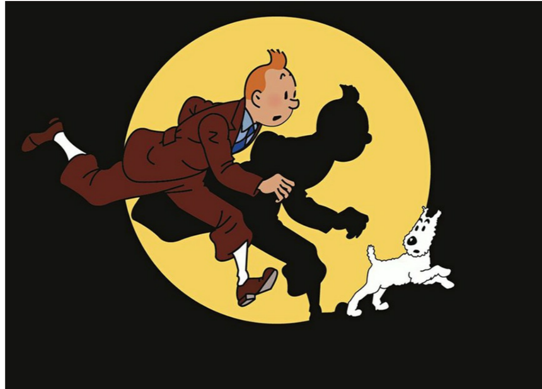
Tintin et Milou