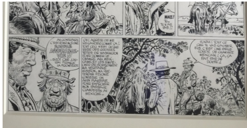
Planche de Blueberry "Chihuahua Pearl" par Gir dans la collection de Sam06

Pour moi, n'en déplaise à certains puristes (Ballade et Spectre), Giraud est au sommet graphiquement sur cet album... et j'adore le scénario.