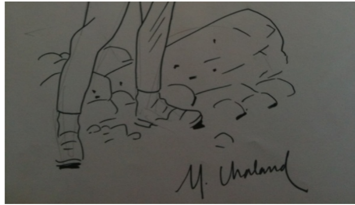
Dédicace d'Yves Chaland

10. Si je pouvais lire la suite d'une bd ?