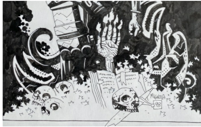
HellBoy par Mike Mignola