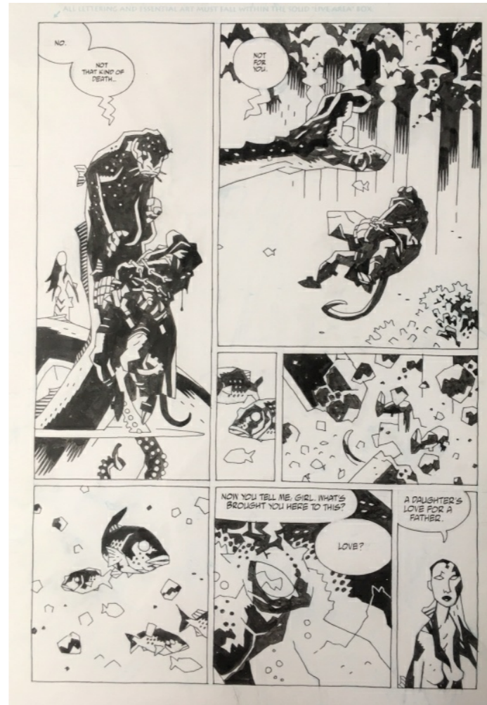
Planche de HellBoy proposée à la vente par Métamorphoses

Rien de tentant pour moi en vente à ce prix-là lorsque j'écris ces lignes, mais je partirais sur une planche de Hellboy (même si elle est déjà réservée) :