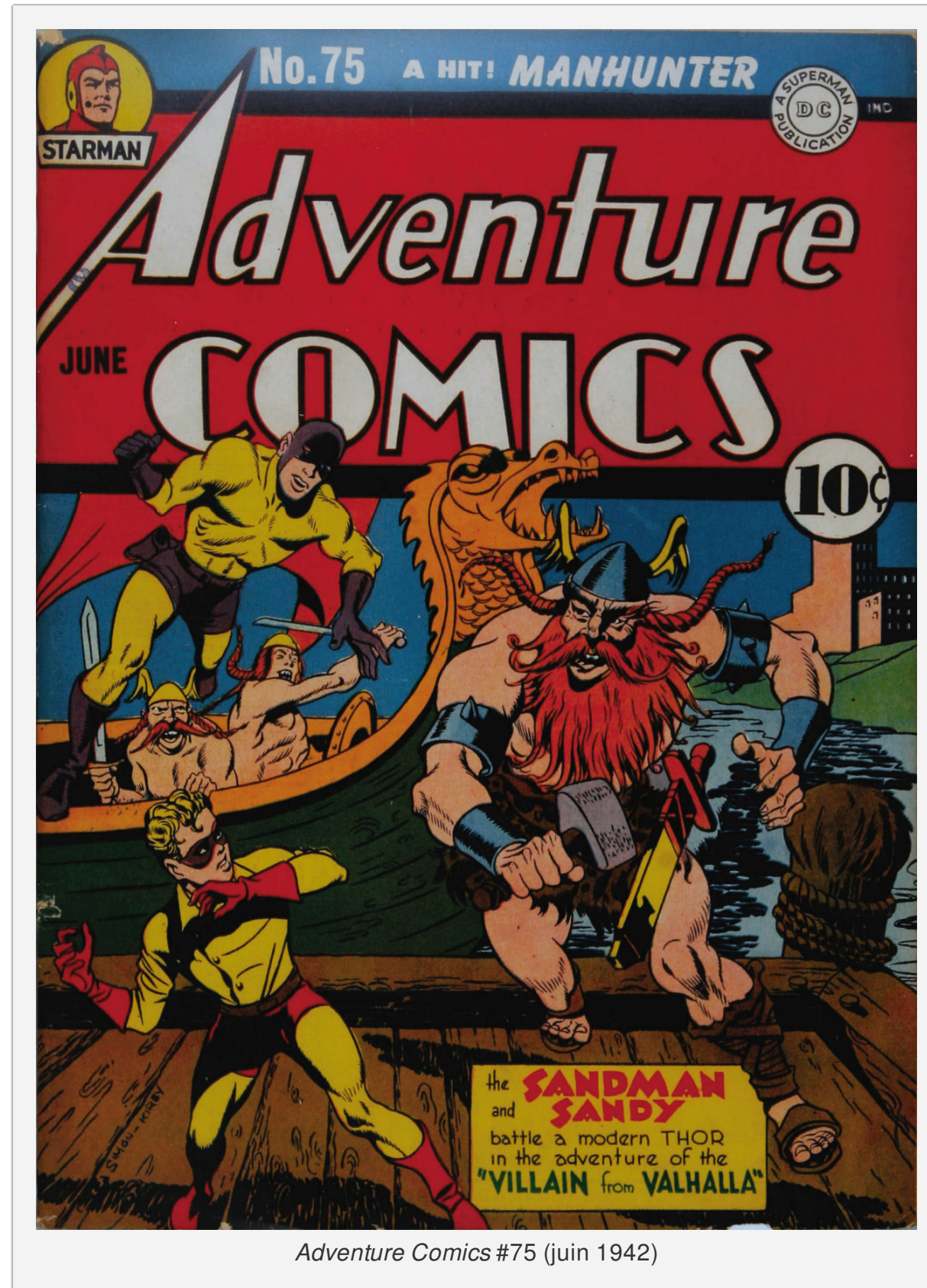
Adventure Comics #75 (juin 1942)

L'image surprendra les fans de comics du XXI e siècle, habitués à voir le dieu du tonnerre version Marvel défendre la veuve et l'orphelin. Elle s'explique par le contexte des années 1940 et le conflit avec le III e Reich. Depuis la Première Guerre mondiale, il est en effets courant