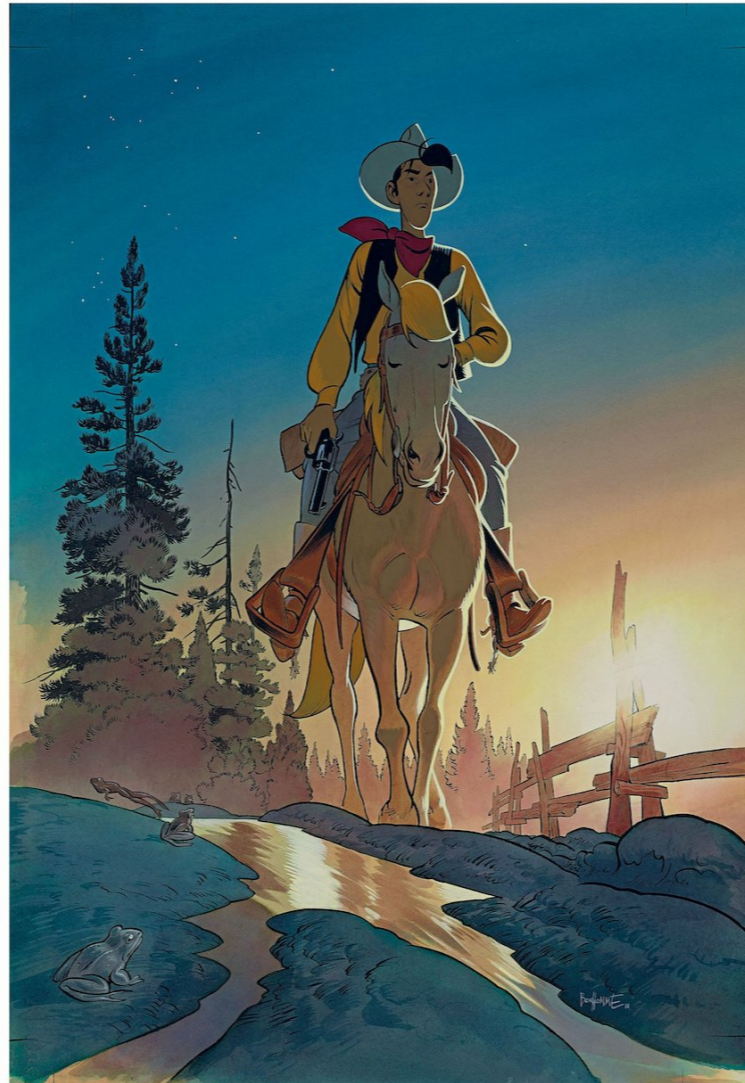
Lucky Luke, vu par Matthieu Bonhomme

Au vu du nombre de navets que l'on a pu voir ces dernières années, particulièrement dans les reprises (à l'exception de Matthieu Bonhomme), j'attends avec impatience ce qui pourrait constituer l'apothéose : Le Chninkel II : la résurrection.