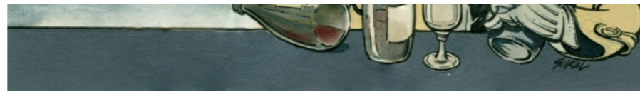
Noces de brume par Benoît Sokal - Couverture originale

D'abord parce que c'est la plus belle couv de Sokal et ensuite parce que je l'ai laissée bêtement filer après une bataille homérique.