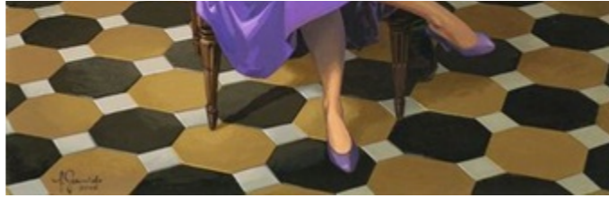
John Blacksad et Alma par Juanjo Guarnido