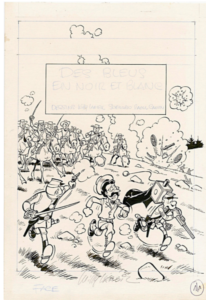
Couverture des Tuniques Bleues par Willy Lambil

Une des meilleures périodes à la fois pour le dessin et le scénario et une touche historique passionnante.