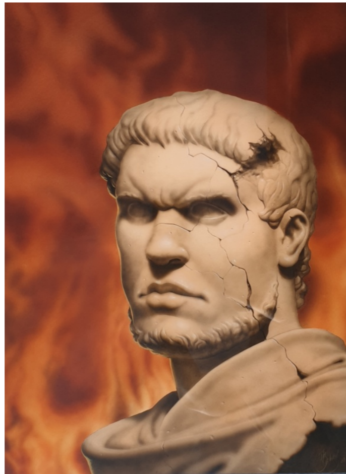
Néron - Couverture du tome 7 de Murena par Philippe Delaby

J'aurais du mal à me séparer de la couverture qui est mon totem :