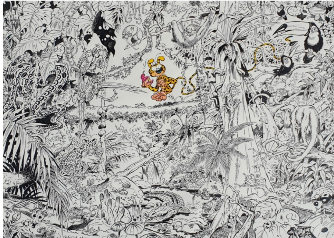
"Tant qu'il y a la vie" par Batem

Mais, J'aurais sans doute encore plus de mal à me séparer de l'œuvre de Batem « Tant qu'il y a la vie » :