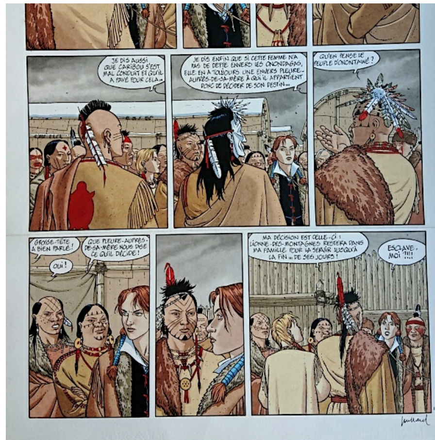
Planche d'André Juillard pour Plume aux Vents tome 3

Mon sang n'a fait qu'un tour ! C'était une somme pour moi à l'époque ! Et puis, tiraillé entre l'envie d'accéder au graal que représente l'acquisition d'une planche d'un auteur que l'on admire et la volonté d'être raisonnable, je me suis décidé à contacter le galeriste, qui a bien voulu me permettre d'acheter ma première planche à crédit.