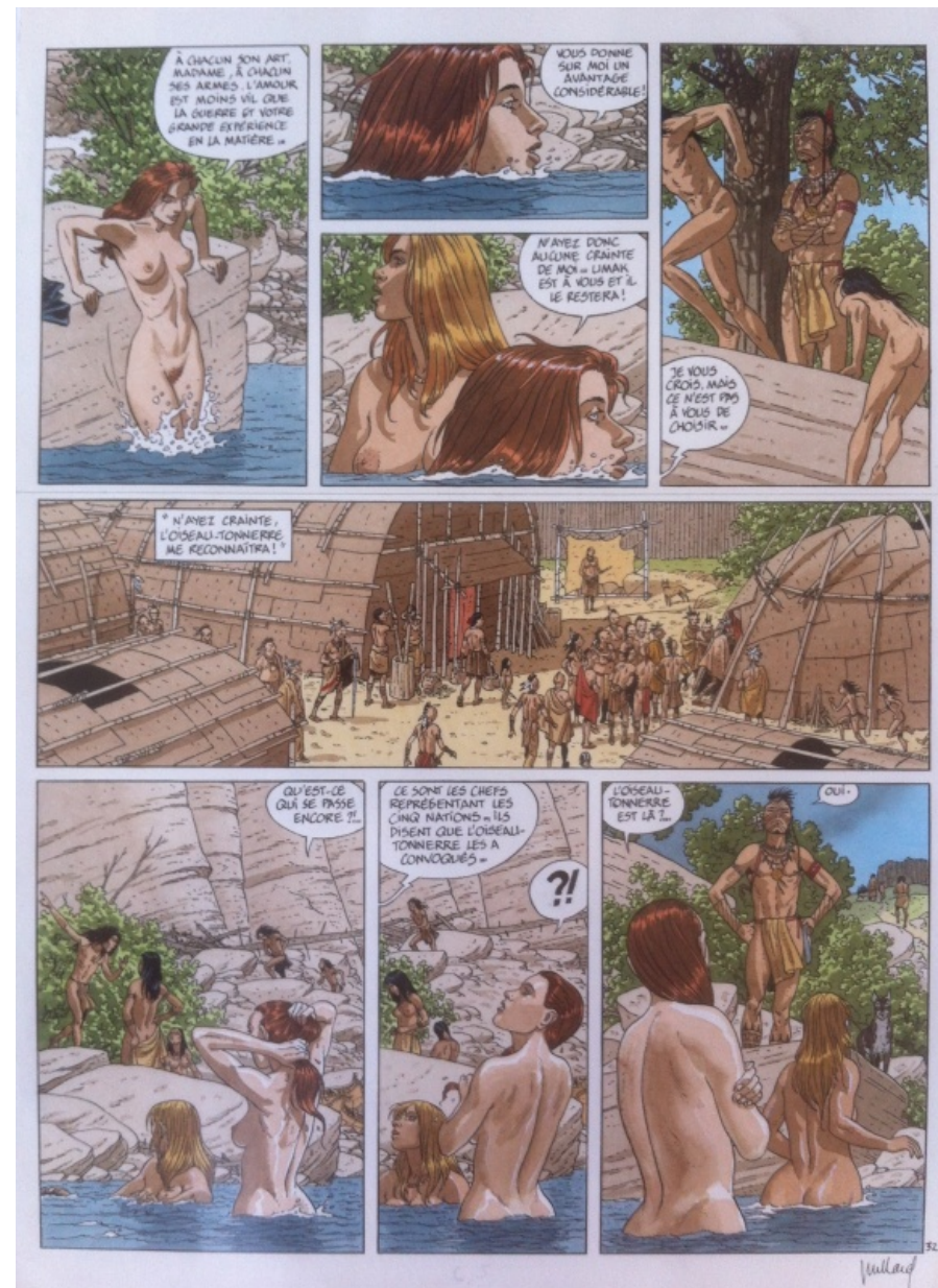
Planche originale de Plume aux Vents par André Juillard

La zone planifiée à laquelle je songe est celle du tome 2 de Plume aux vents où Ariane et Angélique se retrouvent le temps d'un bain.