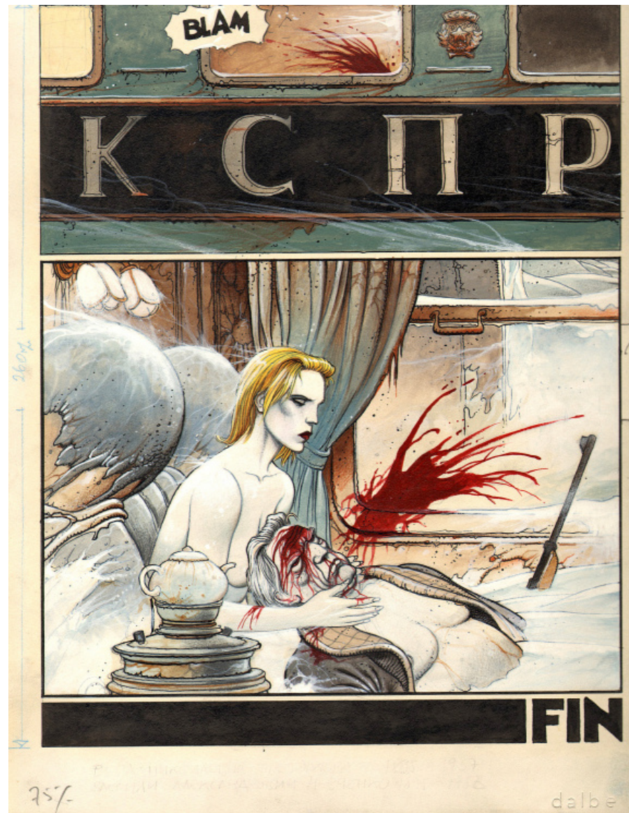
Planche originale de Partie de Chasse par Enki Bilal

Il y a eu tant d'écrits sur Partie de chasse , album mythique, ô combien prémonitoire de la chute du bloc de l'Est et vis-à-vis duquel on ne sait, qui du dessin ou du scénario, porte l'Oeuvre tant le duo Bilal-Christin touche l'apogée de sa collaboration.