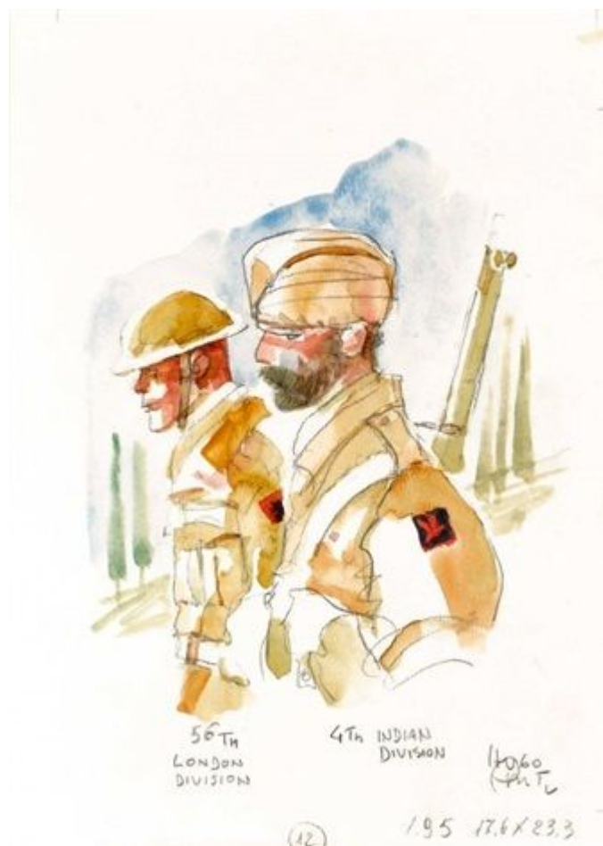
Soldats en uniforme par Hugo Pratt

Je dois également confesser que je me retrouve également en Pratt vis-à-vis de sa fascination des uniformes militaires. Car avant de collectionner les originaux de BD, je collectionnais les uniformes français de l'Armée d'Afrique, ces uniformes hauts en couleur (zouaves, tirailleurs et spahis...). La collection que j'ai vendue pour me consacrer aux originaux de BD !