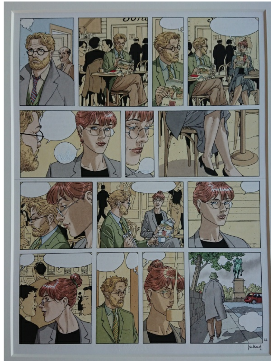
Planche originale de Après la pluie par André Juillard

Je vais hésiter entre ma planche d' Après la Pluie , planche en l'occurrence qui m'était restée en mémoire de l'expo parisienne que j'ai relatée. Planche doublement sentimentale, de par la rencontre de nos protagonistes Abel et Eve, et synonyme d'une période parisienne pour ma part :