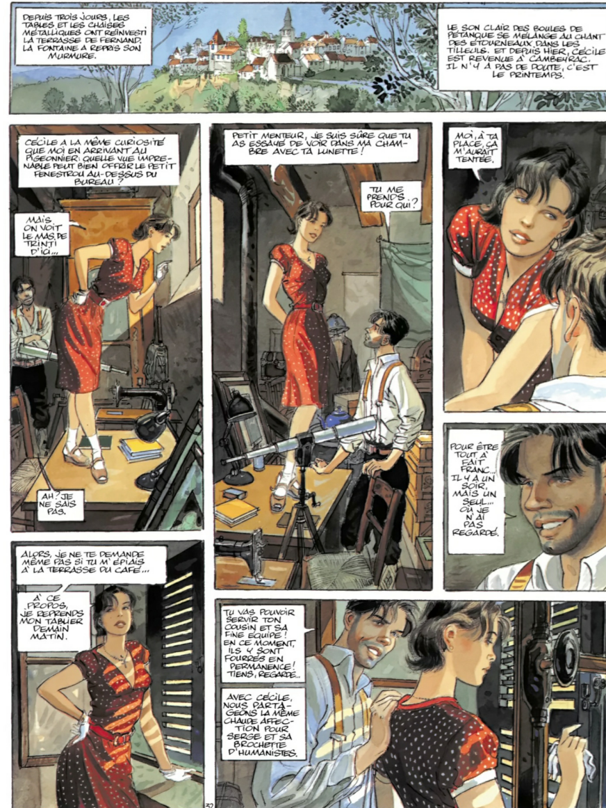
Le Sursis, par Jean-Pierre Gibrat

Il s'agit sans aucun doute de la page 34 du Sursis tome 2, de Gibrat. Un coup de foudre déjà de par sa pleine page dans l'album avant même de voir l'original !